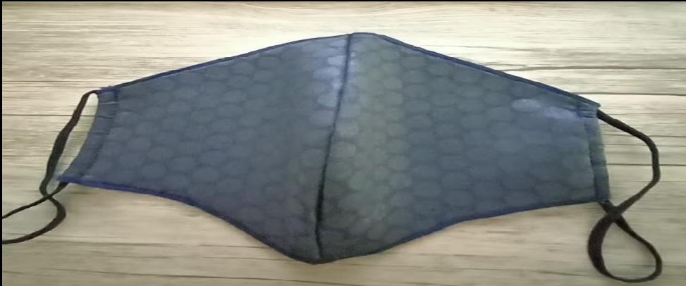
Type 2 : 3D Fashion