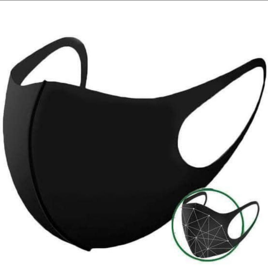
Type 1 : PITA Fashion